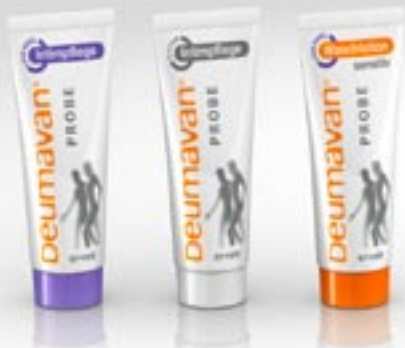
Monstertube zalf met lavendel